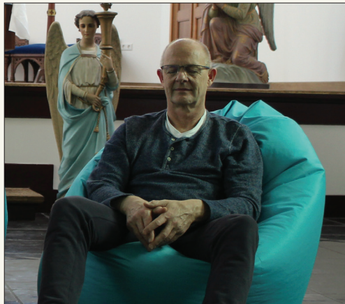
Mediteren in een kerk met vloerverwarming